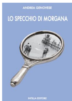
LO SPECCHIO DI MORGANA Intilla 2010, pagine 324, euro 13